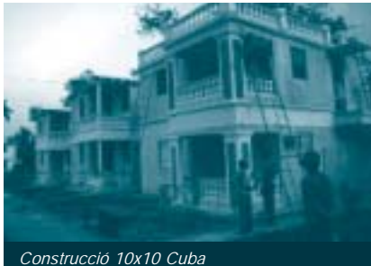
Construcció 10x10 Cuba

processos de formació i creixement: d'una banda, la ciutat formal, controlada i dissenyada per especialistes i, de l'altra, la ciutat produïda socialment, també anomenada