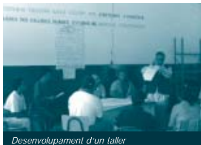
Desenvolupament d'un taller

sector nord-est del Parc Metropolità Albarregas, comprès entre la Cruz Verde i la confluència de la Quebrada de Milla amb el riu Albarregas. De fet, aquest emplaçament és força perillós, ja que aquesta zona andina és sísmicament molt activa i, a més, les pluges poden ocasionar en qualsevol moment grans riuades amb conseqüències desastroses. Els assentaments es localitzen dins o