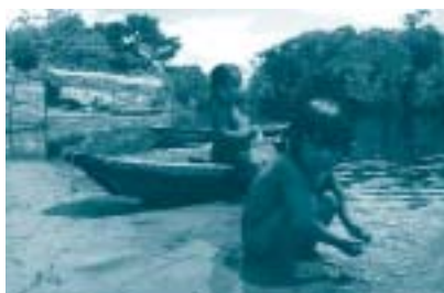
Bany al Padauri

Primer premi per a la fotografia Bany al Padauri , d'Oriol Farràs Ventura.