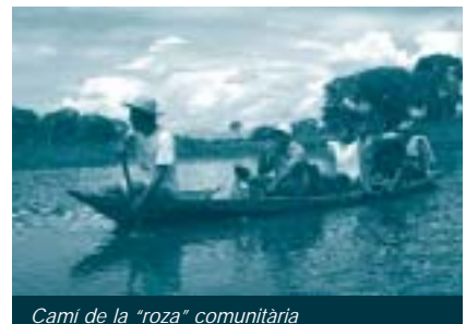
Camí de la "roza" comunitària

Es tracta de millorar els recursos informàtics existents amb la reparació de l'ordinador existent i la compra d'un equip nou. A partir d'aquí, tot el procés d'assimilació de les noves tecnologies es porta a terme de forma participativa, de manera que un membre de la contrapart estigui present des de la compra dels equips fins la seva instal·lació i manteniment. Es realitza també un estudi de les possibilitats de connexió a Internet per part d'ASIBA, així com d'algunes de les comunitats indígenes, amb la realització d'un taller de capaciació de camperols indígenes en l'ús dels equips.