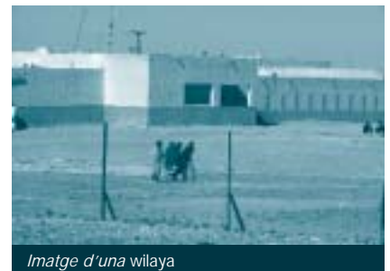
imatge d'una wilaya

A la farmàcia central del RASD es rep tot el material mèdic que és enviat tant per organismes internacionals de cooperació (ACNUR, ECHO, Creu Roja, Mitja Lluna Roja, ICO, CENER, etc.), com a través d'altres iniciatives no governamentals, mitjançant caravanes d'ajuda humanitària. Actualment, els medicaments es reben de forma periòdica i es van emmagatzemant per a la seva posterior distribució entre les farmàcies de cadascun dels poblats ( wilayes ) en funció de la demanda que en fan. El magatzem de la farmàcia central funciona d'una manera manual, amb un sistema que fa que sigui molt complicat portar un control adient d'un material tan important com són els medicaments. Tant els treballadors del magatzem com els mateixos habitants dels campaments, es beneficiaran de la possibilitat de disposar d'un programari que millori la gestió d'aquests recursos, per tal de poder controlar millor, per exemple, el material que tenen emmagatzemat i evitar la caducitat de medicaments per una gestió inadequada. D'altra banda, el fet de poder gestionar de forma més eficient i eficaç els recursos farà que millori la distribució de material mèdic entre les wilayes .