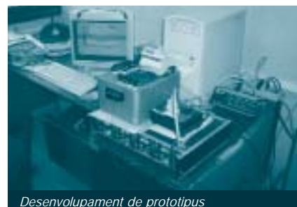
Desenvolupament de prototipus

Es va construir un prototipus de controlador basat en un PC monotaqueta industrial per a la investigació i el desenvolupament de sistemes d'automatització de mini-