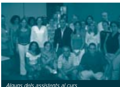
Alguns dels assistents al curs

La realització dels cursos va ser plenament satisfactòria i l'avaluació que en van fer els assistents va ser molt positiva per l'aportació d'idees i de material que, malgrat les dificultats estructurals del país, van valorar que podia ser de gran utilitat per millorar la docència i les seves activitats d'assessorament a empreses.