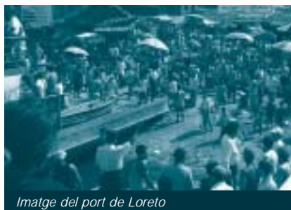
Imatge del port de Loreto

Darrerament, el govern peruà ha aprovat una nova llei que obliga a disposar d'un certificat de coneixements en informàtica per obtenir el títol de professor. L'Institut "el Pedagògic" ( Institut Superior Pedagògic Públic Fray Florencio Alegre González de Requena ) és l'únic centre de formació del professorat de la regió. Aquest centre, que amb prou feines té accés a llibres de text, ara es veu obligat per llei a incorporar la informàtica com una de les seves disciplines. El projecte impulsat per l'associació PROYDE i per TSF és l'única alternativa de què disposen per fer front a aquesta necessitat i, de pas, per poder accedir a material docent en línia per Internet sense costos addicionals. El servei Speedy (banda ampla de Telefónica) no és possible als afores d'Iquitos i, per tant, alum-