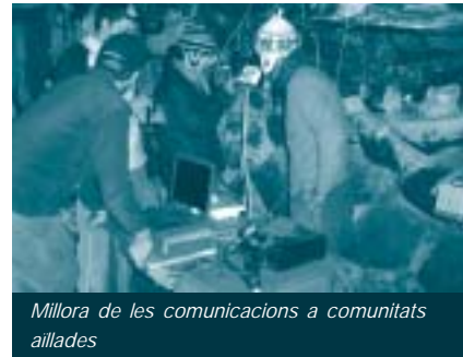
Millora de les comunicacions a comunitats aïllades

En concret, es tracta del muntatge de sistemes de ràdio a noves comunitats i la instal·lació de computadors portàtils, amb el programari lliure d'Enlace Hispano-Americano de Salud (EHAS), adequat per poder rebre i transmetre correu electrònic via HF. També cal fer capacitació en l'ús dels ordinadors, adreçada als responsables de l'ONG, alfabetitzadors i les promotores de salut de les comunitats. L'ordinador i la impressora els són un suport bàsic que els permetran comunicar-se entre ells i amb ADEVAS, i accedir així a formació i informació.