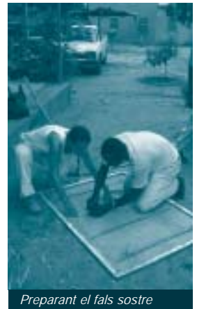
Preparant el fals sostre

Pel que fa a l'actual estat general del projecte en què s'ha integrat l'activitat impulsada pel CCD, s'està continuant la construcció de les dues primeres ampliacions d'escoles, a Dofiguisso i Tolotama. Les aules es cobreixen, es col·loquen les reixes subvencionades pel CCD i s'està portant a terme la instal·lació de mobiliari, instal·lacions elèctriques finals i pintures. Per la seva part, els habitatges per als mestres de les escoles també estan molt avançats i tots -llevat de dos, que s'estan fent- estan en fase de realització d'interiors, terres i treball de fusteria. Es preveu acabar la construcció d'aquestes dues primeres ampliacions d'escoles a final de gener, amb els últims treballs d'acabat d'interiors.