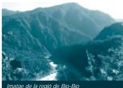
Imatge de la regió de Bío-Bío

Per complir les condicions imposades per aquesta resolució, l'empresa va començar un fort procés intimidatori amb la co-