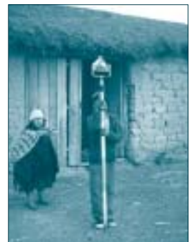
Nens de la comunitat de Tiquipaya

S'ha realitzat l'estudi tècnic sobre el futur emplaçament dels canals a la zona, en base als treballs previs sobre perfils longitudinals i transversals del terreny, pendents, longitud, possibles ubicacions i impacte. La creació dels mapes topogràfics permet tenir un estudi immediat del terreny per poder començar a treballar-hi en la fase constructiva. El fet de realitzar una feina útil per a la gent amb qui s'ha conviscut diàriament i que després rebrà els beneficis