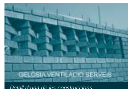
Detall d'una de les construccions

S'ha constatat que treballar en un projecte com aquest sense adequar-lo abans a la realitat presenta els seus riscos i que convé tenir molt present aquesta realitat i els mitjans tècnics i econòmics de què es disposa. Per al grup de treball, l'experiència ha estat molt positiva, s'ha après molt en la construcció i també s'ha ajudat altres persones a formar-se en aquest camp, a entendre millor els plànols i a portar una obra relativament gran. En resum, es donarà a la comunitat una escola per a nens i nenes disminuïts que, si bé per les seves possibilitats no treuran els seus pares de la pobresa ni podran valer-se per ells mateixos, com a persones mereixen una educació i un tracte tan respectuós i digne com qualsevol altre. L'obra es va deixar quan es començava la barana de l'edifici d'aules, sense poder veure acabat cap dels dos edificis, tot i que els treballs ja estaven molt avançats i anaven a bon ritme. La feina dels treballadors continua i la parròquia va informant el grup, per correu electrònic, sobre l'evolució de la construcció, amb la inauguració prevista el gener del 2005.