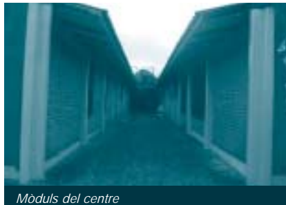
Mòduls del centre

Es preveu desenvolupar el projecte en dues fases: la primera, que es realitza enguany, consisteix en l'avaluació in situ i en l'execució del projecte arquitectònic sobre paper. La segona fase serà pròpiament la construcció del projecte, que està previst que es faci de cara a l'estiu del 2005. El treball inicial es va articular en base a diverses reunions amb la directora de l'ACAI, per conèixer exactament quins espais físics es requeririen, a més d'ampliar els coneixements dels usuaris d'aquest futur mòdul. Després, es va fer un aixecament i diagnòstic de l'edifici actual per, finalment, començar a desenvolupar el projecte arquitectònic del nou mòdul, que va consistir en el desenvolupament del plànol (plantes, talls, façanes, perspectives, etc.) i d'un nou sistema estructural de l'edifici.