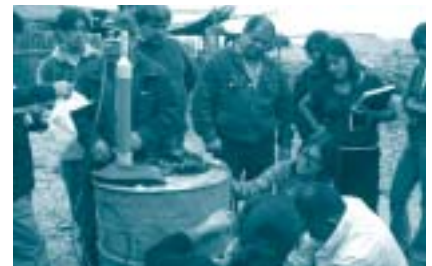
Construcció d'una planta de biogàs a petita escala per obtenir resultats experimentals