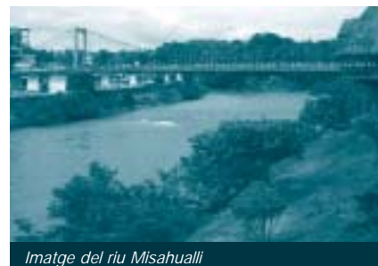
imatge del riu Misahualli

En una primera reunió amb l'alcalde se li van lliurar els resultats del projecte anterior, relatiu al tractament de les aigües residuals de la ciutat i se li van exposar les idees principals sobre els dos projectes, tant el turístic com el més comercial. Es van fer xerrades als alumnes de la Universitat de l'Amazònia i es van visitar alguns poblatos indígenes. Es va recopilar tota la informació sobre la conca hidrogràfica i es va realitzar un mapa topogràfic i d'usos del sòl.