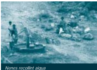
Nenes recollint aigua

Bombai és la ciutat més densament poblada del món i és difícil fer-se una idea de la quantitat de gent que hi conviu i de quines condicions de pobresa i de diferència de classes s'hi poden trobar. L'ONG Commiteed Communities Development Trust (CCDT) es va crear per atendre la gent més desfavorida de la ciutat. Per fer-ho, compta amb treballadors autòctons i voluntaris estrangers que ajuden des de la seva professionalitat al bon funcionament dels centres. També acull gent més jove per realitzar tasques de sensibilització, persones que simplement poden anar a observar i aprendre què passa en un país com l'Índia. D'altra banda, és interessant conèixer el món universitari de la ciutat, els contrastos entre la gent que hi pot accedir i l'estat de la investigació i els projectes que es realitzen, les línies d'investigació, les necessitats que tenen i analitzar fins a quin punt es pot establir alguna col·laboració. Finalment, per ampliar contactes amb altres organitzacions, cal estudiar com treballen les ONG locals, coneixent i analitzant la possibilitat de participar en projectes que desenvolupen a diversos indrets de l'Índia.