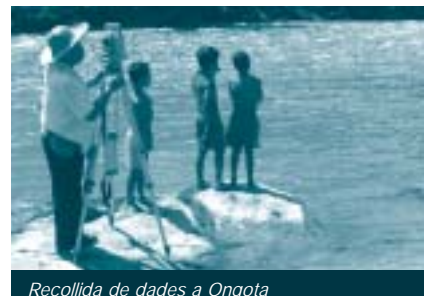
Recollida de dades a Ongota

Actualment s'està en procés de redacció del projecte, i les activitats realitzades fins ara han estat bàsicament d'obtenció de dades de camp. Durant el mes de desembre de 2004, es va recollir la informació necessària, bàsicament dades socials i demogràfiques, sobre els recursos hídrics existents, l'estat dels serveis i dades topogràfiques. El projecte és una gran oportunitat d'ajudar un col·lectiu de persones que viu en la pobresa i amb unes condicions sanitàries molt deficitàries, que es veurien molt millorades amb la introducció d'unes xarxes d'abastament i sanejament eficients. Amb això, s'evitarien moltes malalties i s'aconseguiria un salt qualitatiu important en el nivell de vida dels seus habitants.