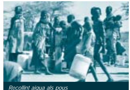
Recollint aigua als pous

Estudi hidrogeològic amb resultats específics sobre alguns dels aqüífers existents i la qualitat de l'aigua que se n'extreu.