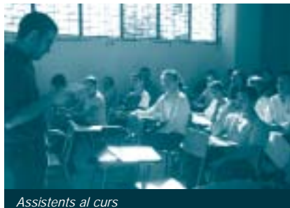
Assistents al curs

La finalitat d'aquest projecte és millorar l'accessibilitat als serveis de salut visual de la població més desfavorida, mitjançant l'ampliació del ventall d'oferta educativa de la universitat pública salvadorenca, concretament a través de la Facultat de Medicina de la UES. Així, es vol reforçar la formació del professorat local de la Universitat, dissenyant un pla d'estudis per a la Llicenciatura en Optometria i per a un Postgrau en Oftalmologia. Igualment, es tracta de consolidar un curs bàsic d'Òptic d'Atenció Primària (OAP) i d'elaborar i publicar un CD que fomenti la transferència de coneixements. Per tant, el projecte de formació de recursos humans en Salut Visual a la Facultat de Medicina de la UES es divideix en tres àrees: Diploma d'Atenció Primària, Llicenciatura en Optometria i Postgrau en Oftalmologia. En paral·lel, també es tracta