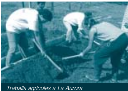
Treballs agrícoles a La Aurora

Actualment es desenvolupa una agricultura no sostenible a llarg termini basada en el sistema roza, tumba y quema , amb un creixement continu del sòl agrícola en detriment del forestal, cosa que