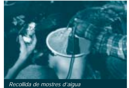
Recollida de mostres d'aigua

que caldrà dur a terme al llarg de l'any 2005, quan finalitzi aquest projecte de cooperació. També, en referència a les tasques de difusió pública de les qüestions relatives a la contaminació, es va proposar fer a curt termini un pla d'actuacions amb la Universitat del Valle i la CVC, posant èmfasi en la formació.