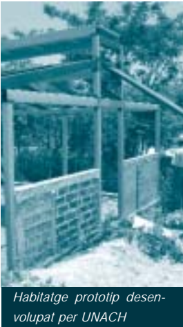
Habitatge prototip desenvolupat per UNACH

procés de substitució d'habitatge. Les poblacions amb pocs recursos, que són la majoria, construeixen barris sencers de forma irregular, sense cap tipus d'ordenació ni de lots previs i amb tècniques d'autoconstrucció. Això dona lloc a barris sense cap infraestructura i amb una tipologia d'habitatge a base de xapa i materials sobrants d'altres construccions. Aquests habitatges tenen un comportament pèssim a nivell tèrmic, acústic, higiènic i estructural.