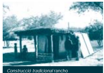
Construcció tradicional rancho

S'ha anat elaborant un manual sobre les propostes constructives de millora que s'han generat durant el treball del grup, avaluant el procés històric de la construcció del ranxo. Es va acabar fent una anàlisi comparativa de les virtuts i els defectes de la tecnologia tradicional respecte dels nous models constructius que s'estan important a la zona, per tal de conèixer i analitzar la percepció dels camperols sobre la seva pròpia tecnologia i per recollir