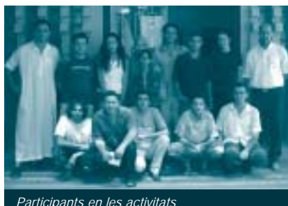
Participants en les activitats

En general, l'educació al Marroc encara està a l'abast de poca gent. La taxa d'analfabetisme és molt alta, especialment entre les dones (85%), i més del 40% dels nens en edat escolar no reben cap tipus de formació. Un percentatge elevat de joves abandonen els estudis molt aviat, esperant obtenir per altres vies els recursos econòmics que necessiten.