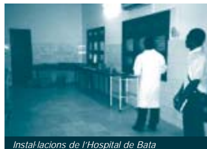
Instal·lacions de l'Hospital de Bata

retinoscopis, bise-lladores, etc.) que fan gairebé impossible obtenir ulleres en aquest establiment. Per això, només s'hi fan consultes optomètriques i, quan es prescriuen ulleres, es realitzen les comandes a Camerun. L'altra possibilitat és comprar ulleres a venedors ambulants que les venen sense cap criteri, com si es tractés d'un complement de moda. De la mateixa manera, al país no existeixen estudis d'oftalmologia i, encara menys, d'òptica i optometria.