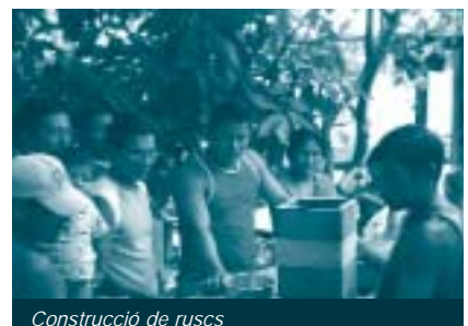
Construcció de ruscs

Els següents passos importants per a la consolidació d'aquesta activitat són l'adquisició d'alguns materials que facilitaran el treball (robes especials, centrífugadora, etc.), les construccions de ruscs propis per allotjar les abelles, el reconeixement a Barcelos del grup d'agricultors indígenes com a criadors d'abelles i productors de mel de bona qualitat, la participació a trobades per tal d'establir contactes amb altres entitats, la realització de nous cursos d'apicultura el mes de febrer, l'elaboració i impressió de 50 manuals de formació per als cursos, visites a altres comunitats indígenes i la construcció de la casa forn comunitària lapunaruka són algunes de les activitats que es duran a terme en els propers mesos.