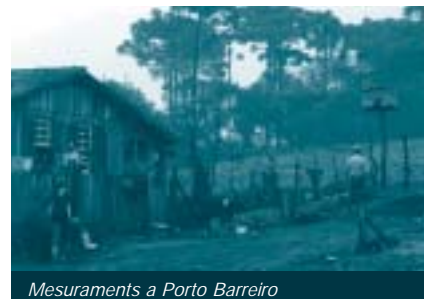
Mesuraments a Porto Barreiro

l'accés a l'assistència mèdica, i per poder ampliar les seves perspectives de desenvolupament. Actualment, la població de Porto Barreiro pateix els efectes d'una manca d'ordenació de vies de comunicació i d'una estructura deficient de la xarxa de clavegueram en un sector important del municipi, cosa que provoca problemes higiènics. Aquests dos aspectes fan minvar les perspectives del desenvolupament local i, per tant, la població s'hi veu directament afectada. El fet de disposar d'una informació cartogràfica actualitzada els facilitaria una eina bàsica per al desenvolupament de la zona. A més de la població rural de Porto Barreiro, altres beneficiaris serien la població veïna de Guarapuava, situada a 50 km, on hi ha la Universitat del Centre Oest de Paranà (UNICENTRE).