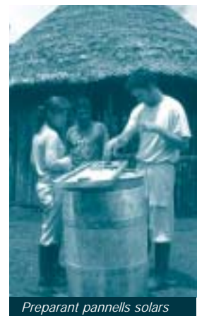
Preparant pannells solars

A l'àrea de comunicacions es va realitzar una anàlisi tècnica de la infraestructura actual de ràdios a les comunitats i a l'oficina central de Puyo. Es van revisar les instal·lacions de plaques solars, la ubicació de les antenes, el funcionament dels equips de ràdio i la seva correcta utilització per part dels responsables. Pel que fa al suport en telemàtica, en primer lloc es va analitzar la situació actual dels equips informàtics a la central de Puyo. A continuació, es va reinstal·lar el sistema operatiu, antivirus i aplicacions d'ofimàtica a cadascuna de les estacions de treball. Posteriorment, es va implementar un projecte de cablatge estructurat per proveir de connexió mitjançant tecnologia Fast Ethernet .