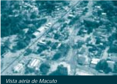
Vista aèria de Macuto

Veneçuela i es va mantenir en forma de tempesta quasiestacionària, un nom que designa el fenomen que es produeix quan les cèl·lules convectives de la tempesta es realimenten en una mateixa àrea sense