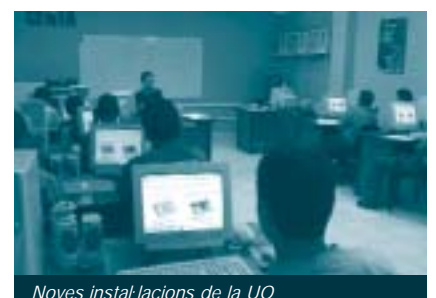
Noves instal·lacions de la UO

També es van acordar les bases per a futures col·laboracions, a través d'entrevistes amb diversos professors del Departament. En aquests moments s'està avaluant, conjuntament amb professors del CEIB, la possibilitat de plantejar nous projectes de suport i, d'altra banda, es manté la relació de col·laboració en aspectes docents i tècnics relacionats amb el projecte finalitzat.