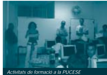
Activitats de formació a la PUCESE

litzar, almenys a nivell d'usuari. També s'introdueix l'alumne en la filosofia GNU i de programari de lliure distribució, diferent del denominat gratuit , un recurs que es considera molt útil