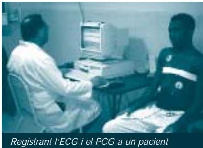
Registrant l'ECG i el PCG a un pacient

Desenvolupar un sistema de baix cost per registrar i processar en un ordinador els senyals de l'electrocardiograma (ECG) i el fonocardiograma (PCG), que complementi els mètodes que s'utilitzen actualment, millorant així l'assistència sanitària que reben els pacients ingressats en els serveis de Cardiologia de l'Hospital Saturnino Lora i de l'Hospital General Clínic Quirúrgic de Santiago de Cuba. Desenvolupar algoritmes per al processament dels senyals i aconseguir informació que no és possible obtenir per auscultació. Desenvolupar programes de control i interfícies gràfiques amistoses que puguin ser utilitzades pel personal mèdic en l'adquisició dels senyals i la seva anàlisi.